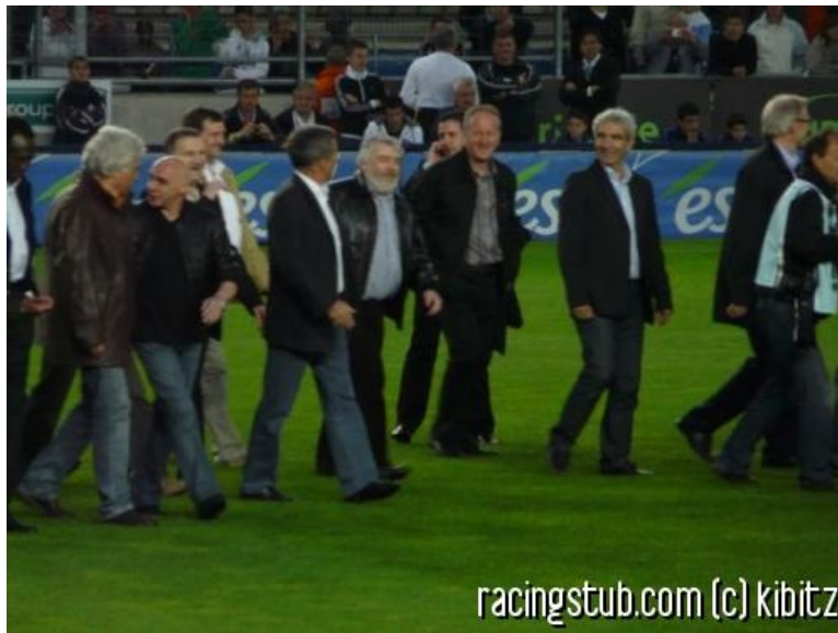
30 ans après, avant le match contre Metz

☆☆☆☆ (0 note) 📅 13/05/2009 05:00 📍 Souvenir/anecdote 👁 Lu 3.263 fois 👤 Par filipe 🗨 0 comm.